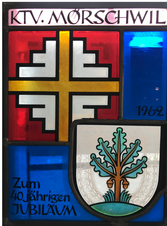
KTV 40-Jahr-Jubiläum 1962

(1) Von Norden einwandernde freie Alemannen befreien die menschenleere Gegend vom Urwald und bebauen das Land. Der großherzige fromme Adalbert schenkt 811 sein Gut dem Kloster. (2) Andere Mörschwiler Bauern beharren bei ihrer seit Urzeit angestammten Freiheit und sprechen auf freien Höfen unter der Gerichtseiche selbst Recht. Aus staatsbürgerlicher Einsicht und aus freien Stücken schließen sich 1469 die Mörschwiler Freibauern jedoch dem Territorialstaat des Abtes Ulrich Rösch an. (3) Der kühne Ammann Hädiner erwirkt schließlich auf einer Romwallfahrt 1498 beim Papst das Recht zur Gründung einer eigenen Pfarrei Mörschwil.