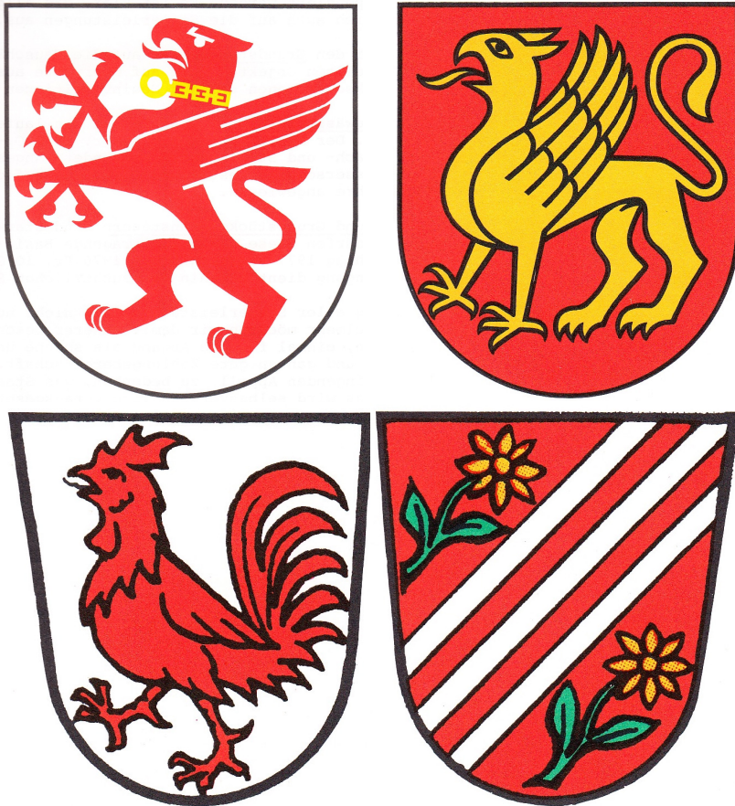
Aufrechter und stehender Greif, Wappen Blarer und Abt Reher (GAR)

Am 6. Juli 1978 wurden die drei Vorschläge im Mitteilungsblatt mit Kommentaren publiziert. Erneut bat der Gemeinderat um Stellungnahme: »Wir meinen, die Diskussion war fruchtbar. Der neue Vorschlag mit dem schreitenden Greif ist heraldisch besser, farblich ansprechender und ohne Aggressivität. Wir stellen das neue Wappen nochmals zur öffentlichen Diskussion. Wir möchten gerne erfahren, ob eventuell eines der beiden Alternativwappen eher gefällt. Der 15. August 1978 ist Eingabeschluss.«