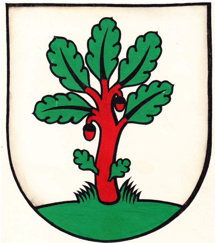
MÖRSCHWIL Originalfassung von Willy Baus 1934 (GAR)

Nach dem Ende des Weltkriegs halfen aktive Vereine und wirtschaftlich allmählich bessere Zeiten der Gerichtseiche in Wappen und Flagge zu immer mehr Darstellungen. Die rotstämmige Eiche wuchs auf Mörschwiler Vereinsfahnen, auf Zinnbechern und Zinnkannen, auf Ehrengaben und gemalten Wappenscheiben. Auch die Primarschule hatte jetzt eine eigene Fahne mit dem Gemeindewappen.