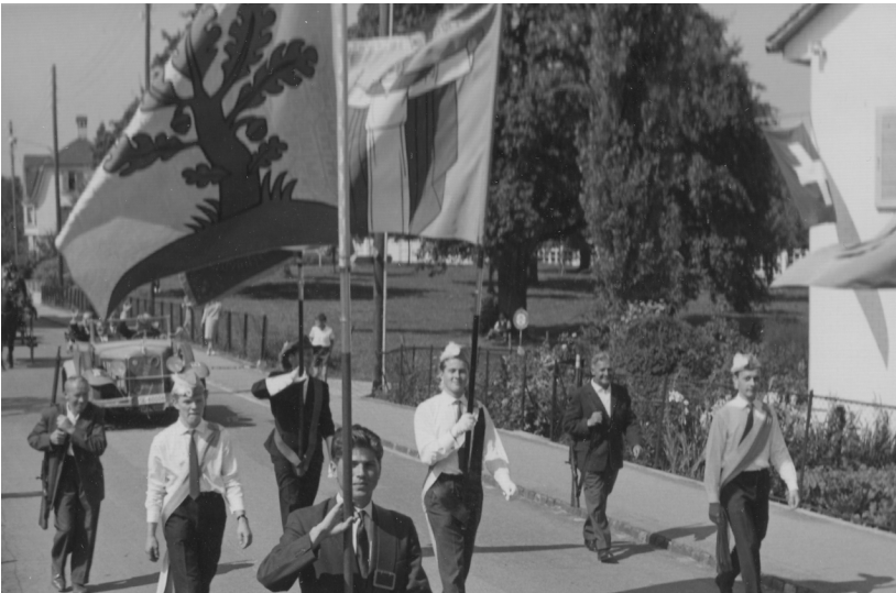
Links die Flagge des ETV – Festumzug beim Ortsjubiläum 1962 (GAR)

Ähnlich wie in der griechischen Sagenwelt Menschen zu den Göttern auf den Olymp entrückt werden, erlebte die Mörschwiler Gerichtseiche bei der 1150-Jahr-Feier ihre Apotheose.