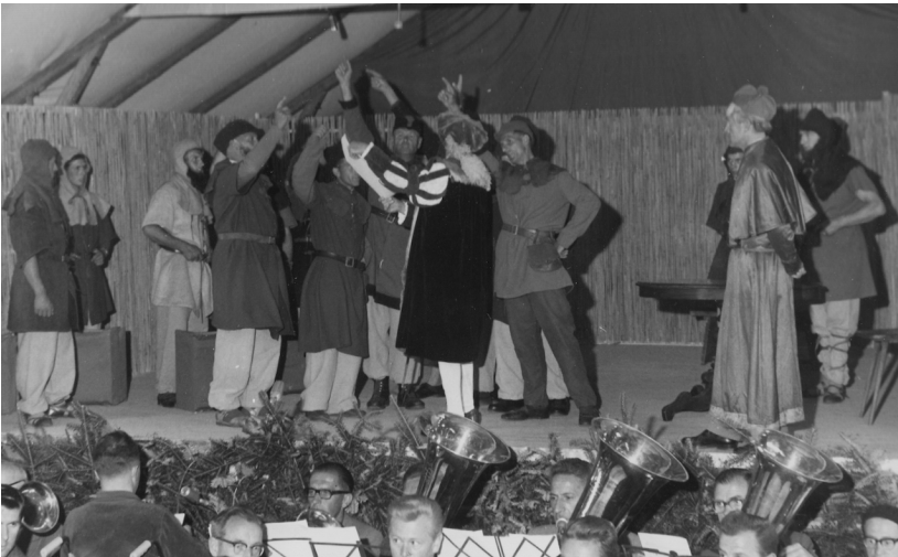
Mörschwiler Gründungsschwur von 1469 im Festspiel von 1962 (GAR)

Sollen sie sich, angesichts der komplexer werdenden Rechtsfragen, nicht besser zu einer Gemeinde zusammenschließen und, wie es Fürstabt Ulrich Rösch vorschlägt, einen Gerichtskreis unter der Oberhoheit des Klosters bilden?