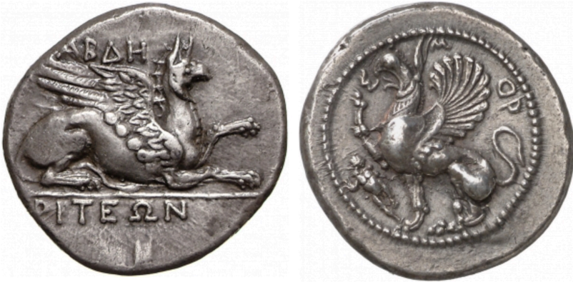
Abb. 1 Greifenmünzen aus Abdera im Norden Griechenlands. Links rund 320 v. Chr. mit Inschrift ABΔHPITEΩN – rechts rund 470 v. Chr.

Der Gemeinderat entschied, in der ganzen Frage über die Bücher zu gehen. Unter Zeitdruckstand man schließlich nicht.