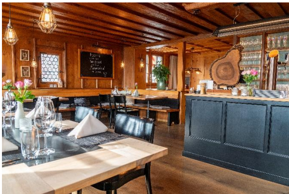
Gaststube mit Buffet